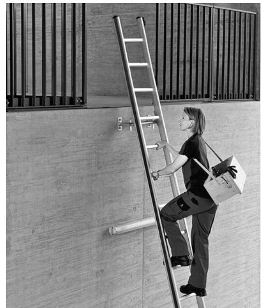
Bild 7: Leiter sicher besteigen: Blick zur Leiter, gutes Schuhwerk, Hände an den Sprossen, Material in Transportkiste

20. Werden die Leitern so gelagert , dass sie vor schädigenden Einwirkungen geschützt sind (z. B. Feuchtigkeit, aggressive Dämpfe)? ja teilweise nein