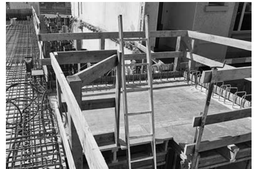
Bild 8: Die Leiter ragt mind. 1 m über die Ausstiegskante, ein sicherer Überstieg mit Geländern ist sichergestellt