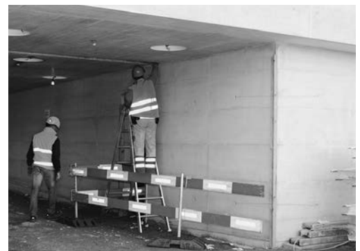
Bild 5: Beim Einsatz im Bereich von Verkehrswegen muss der Standort der Leiter gesichert werden.