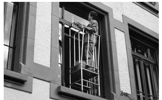
Bild 6: Schutzgeländer, das sich mit einem Griff zwischen Fenster und Fensterrahmen einhängen lässt.

Siehe auch Checklisten «Elektrohandwerkzeuge» (Bestell-Nr. 67092.d), «Elektrizität auf Baustellen» (67081.d) und «Böden» (67012.d)