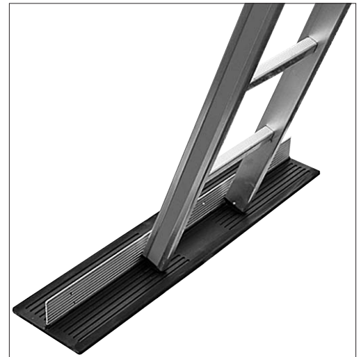
Bild 2: Durch eine geeignete Unterlage (z. B. Anti-rutschmatte etc.) wird das Wegrutschen des Leiterfusses verhindert.